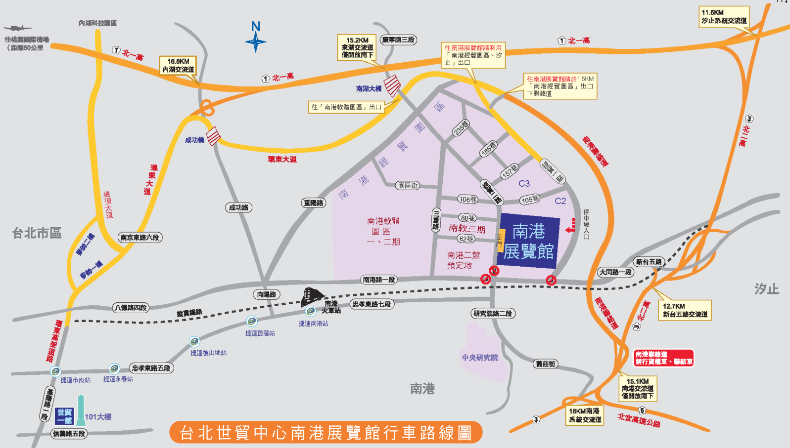
台北世貿中心南港展覽館行車路線圖

往南港展覽館行車路線說明：(南港展覽館衛星導航座標：X(經度):121° 34' 58.9"、Y(緯度): 25° 47.6")