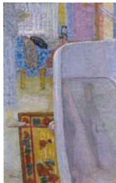
浴盆中的女子，約1883，愛德加·德加 (1834-1917) Woman in a Tub, c.1883, Edgar Degas (1834-1917)

The Bath of Psyche, 1890 (first exhibition), Frederic Lord Leighton (1830-1896)