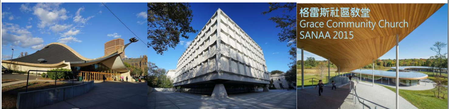
格雷斯社區教堂 Grace Community Church SANAA 2015

【 耶大英格斯冰場 Ingalls Hockey Rink - Eero Saarinen 1958 】