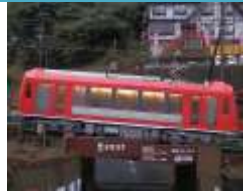
箱根登山斜面電車