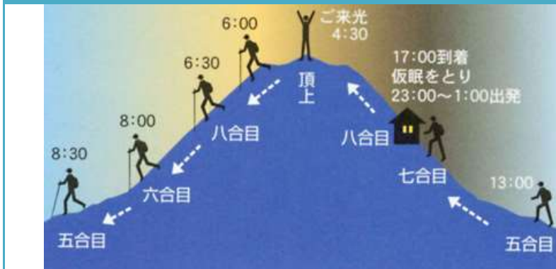
富士山攻頂時間路線示意圖