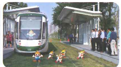
高雄輕軌車廂與C2車站 照片來源:高雄市政府捷運工程局。