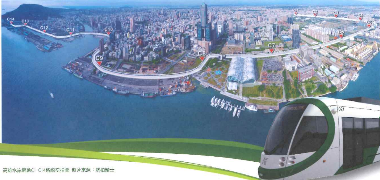
高雄水岸輕軌C1-C14路線空拍圖