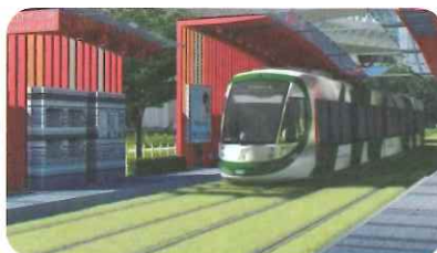
高雄輕軌C3車站外景透視圖