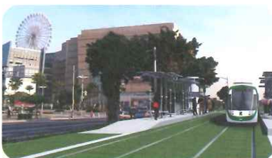
高雄輕軌行經夢時代購物中心C5車站